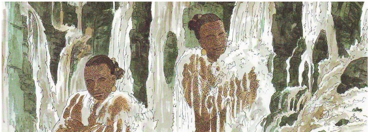
LES DERNIERS GÉANTS, FRANÇOIS PLACE, ÉDITIONS CASTERMAN